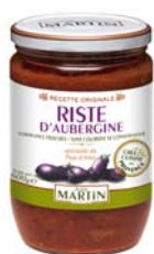
Riste d'aubergine 600g et 240g