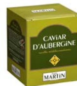
Caviar d'aubergine 380g