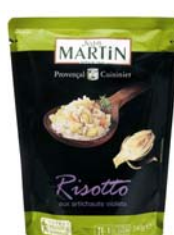
Risotto aux artichauts violets 240g