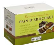
Pain d'artichaut 470g