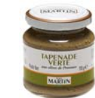
Tapenade aux olives vertes 110g