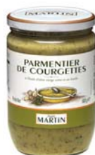
Parmentier de courgettes 600g