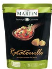
Ratatouille aux pommes de terre 240g

Jean Martin a été primé au MIFFEL 2009 pour cette gamme « nomades » en sachets doypacks favorisant la consommation de fruits et légumes.