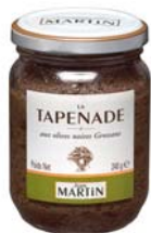
Tapenade noire 240g et 110g