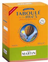
Taboulé de la mer 630g et 220g