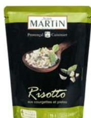
Risotto aux courgettes et pistou 240g