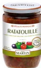
Ratatouille 600g et 240g