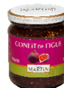
Confit de figue 240g