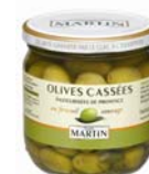
Olives cassées 385g