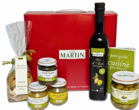
Coffret « Le Maussanais »

En vente à la Boutique ou sur le site Internet, ils sont particulièrement appréciés par les comités d'entreprise en fin d'année et constituent des cadeaux adaptables à toutes les bourses.