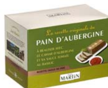
Pain d'aubergine 570g