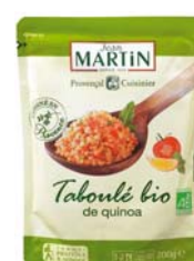
Taboulé bio de quinoa 200g