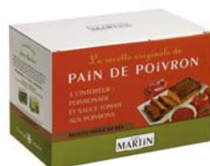
Pain de poivron 550g