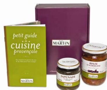
« Spécialités du Pays d'Arles »