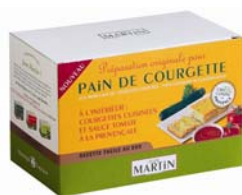
Pain de courgette 550g