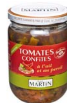
Tomates confites 220g